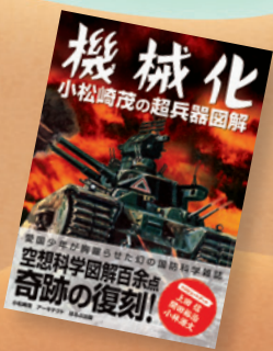
▲「機械化 小松崎茂の超兵器図解」 ・アーキテクト [編集・デザイン]