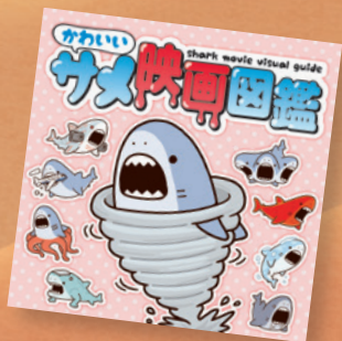
▲「かわいいサメ映画図鑑」 ・ライノックス [企画・編集・デザイン]