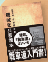
▲「機械化兵器読本」 ・アーキテクト [編集・デザイン]