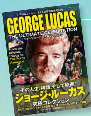
▲「ジョージ・ルーカス 究極コレクション」 ・アーキテクト [翻訳・編集・デザイン]

モノポリーライクなボードゲーム「サメポリー」に続いて、「戦国鉄道」「極道コミケ」「鎧神」などのカードゲームをリリース予定。