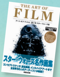
▲「アート・オブ・フィルム」 ・アーキテクト [翻訳・編集・デザイン]