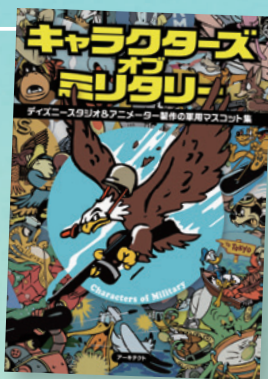
▲「キャラクターズ・オブ・ミリタリー」 ・アーキテクト [企画・編集・デザイン]