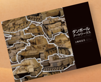
▲「ダンボールアートワークス」 ・ゼロタイプ [編集・デザイン]