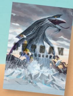
▲「幻獣神話展VI」 ・アーキテクト [編集・デザイン]