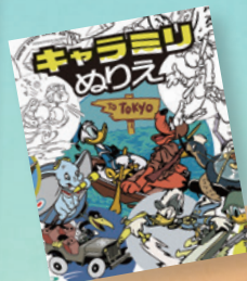
▲「キャラミリめりえ」 ・アーキテクト [企画・編集・デザイン]